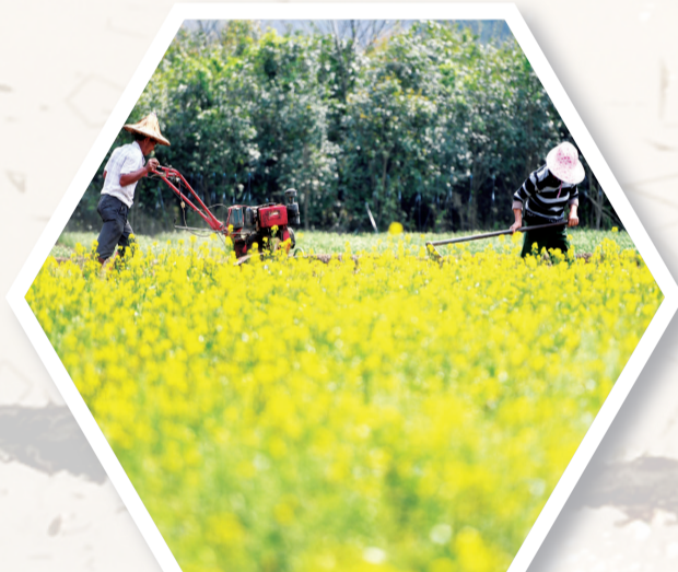
柳江区进德镇龙新村，两名村民在油菜花盛开的地里劳作。