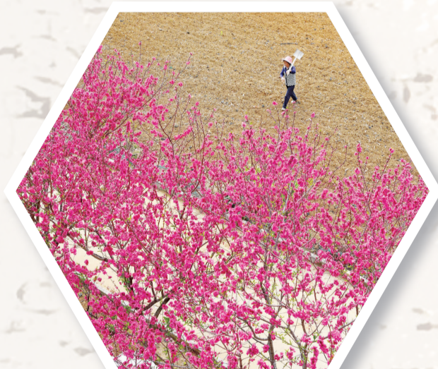
柳江区进德镇龙新村，田间地头的桃花开得正艳。