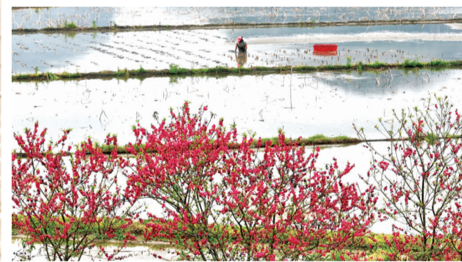
柳江区百朋镇怀洪村，村民在藕田里种藕。