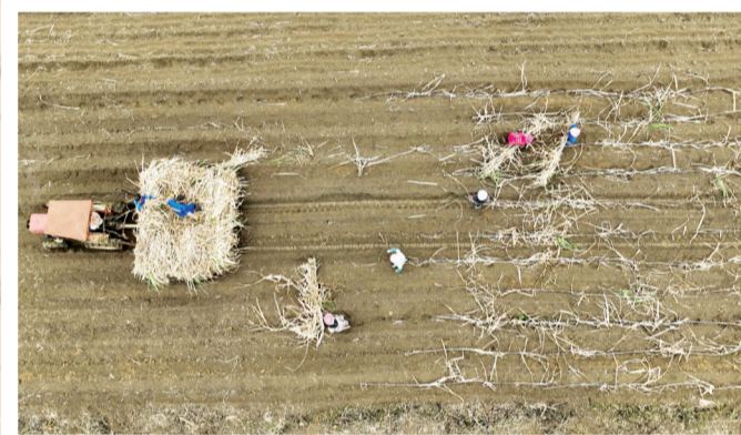
柳江区穿山镇龙凤村，村民在地里种植甘蔗。