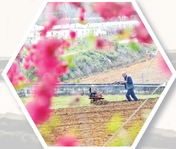
柳江区进德镇龙新村，村民在翻耕土地。

连日来，柳州气温逐渐升高，广阔的乡村田野上春花竞相开放，雪白的梨花、粉红的桃花、金黄的油菜花……各色花朵扮靓了乡村，引来众多游客外出赏花、踏青。和煦的阳光下，春花烂漫的田间地头处处是一片忙碌的景象。