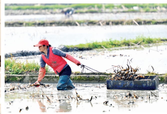
柳江区百朋镇，村民把刚挖出来的莲藕转移到藕田里种植。