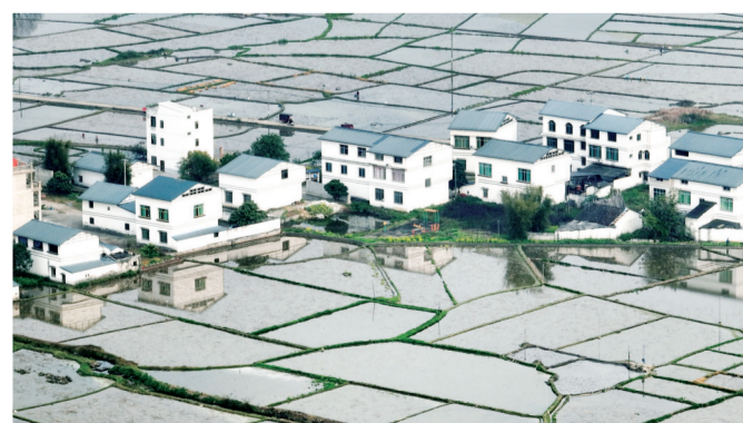
柳江区百朋镇万亩藕田美如画卷。