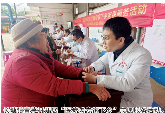
长塘镇青茅村开展“医疗老专家下乡”志愿服务活动。