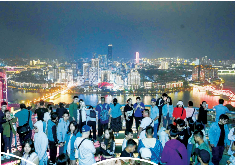
↑夜幕降临，在马鞍山观景平台，游客在拍摄美丽的柳州夜景。