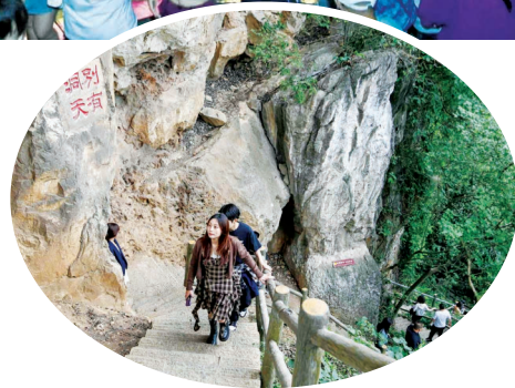
←游客在攀登龙潭公园内的镜山。