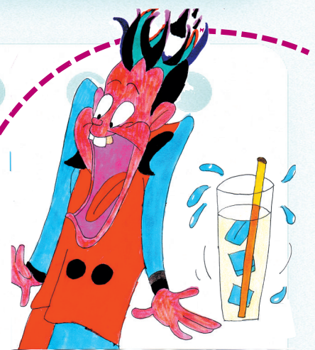
小记者 弯塘路小学六年级(5)班 马傲儒 作