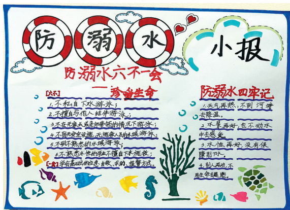
小记者 弯塘路小学2018级(5)班 李亚宸 作