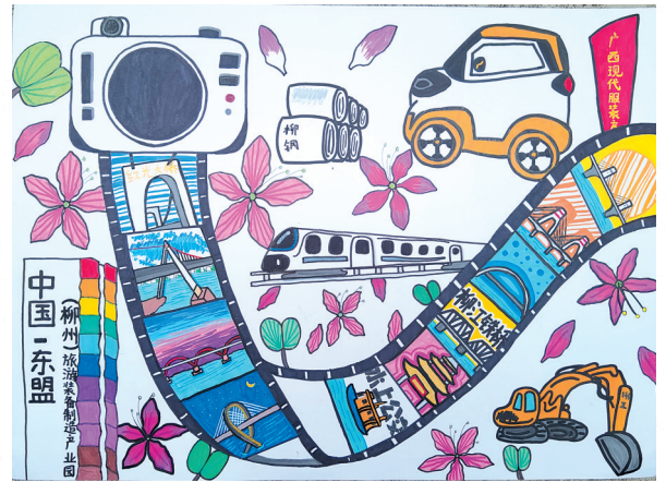
小记者 西江路小学2019级(1)班 舒玥麟 作