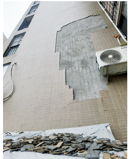
脱落和松动的外墙瓷砖。

随后，记者又将情况向解放街道办事处进行了反映，街道办相关负责人表示将督促物业加强排查，且在维修前要做好相关警示。