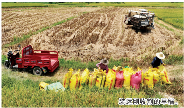
装运刚收割的早稻。