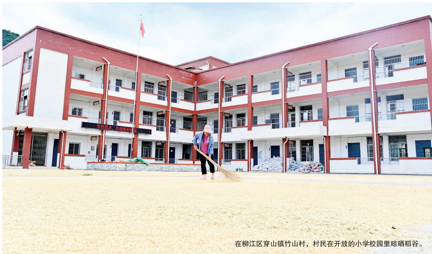
在柳江区穿山镇竹山村，村民在开放的小学校园里晾晒稻谷。