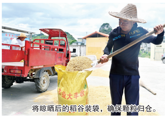
将晾晒后的稻谷装袋，确保颗粒归仓。