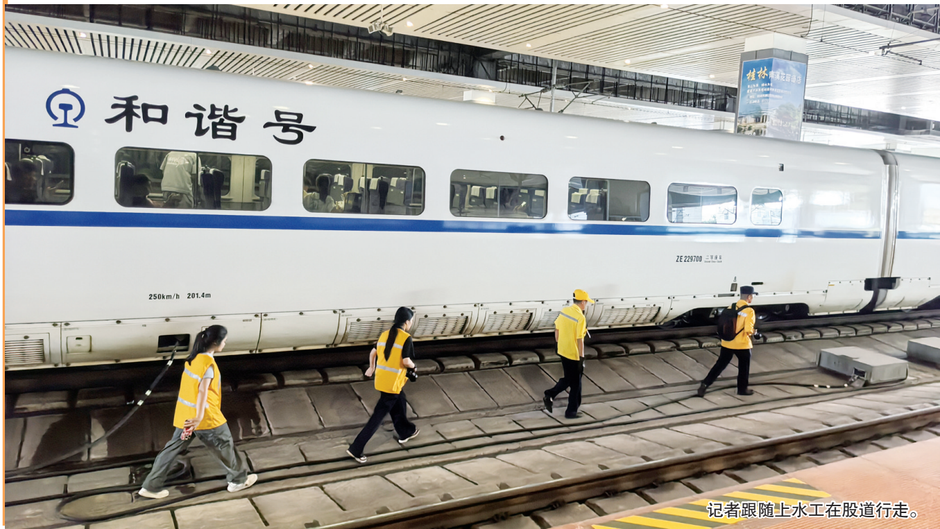
记者跟随上水工在股道行走。